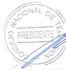
OSCAR REYES PEÑA PRESIDENTE CONSEJO NACIONAL DE TELEVISIÓN