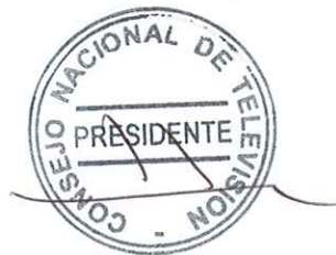
Herman Chadwick Piñera Presidente Consejo Nacional de Televisión